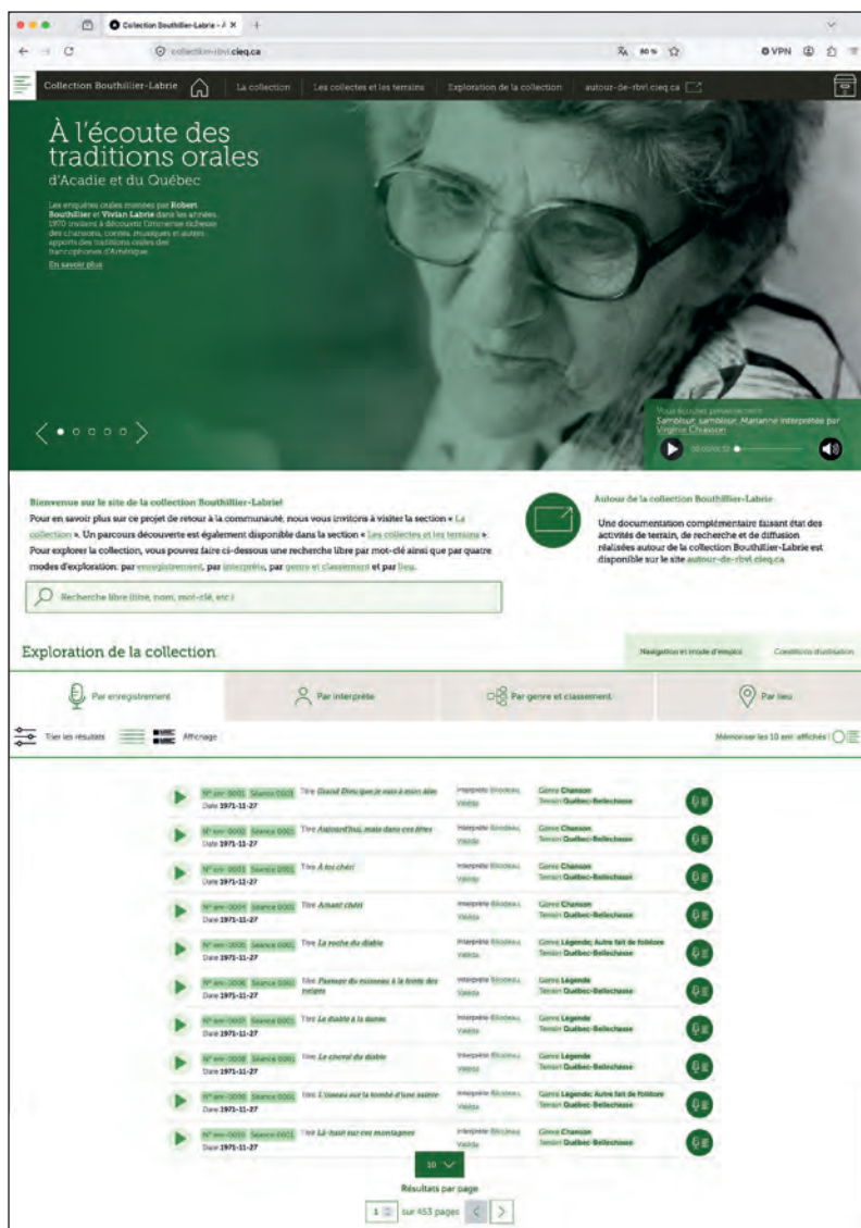
■ Une page du site « À l'écoute des traditions orales » consacré à la collection et réalisé par le Centre interuniversitaire d'études québécoises.

Le site compagnon : https://autour-de-rbvul.cieq.ca